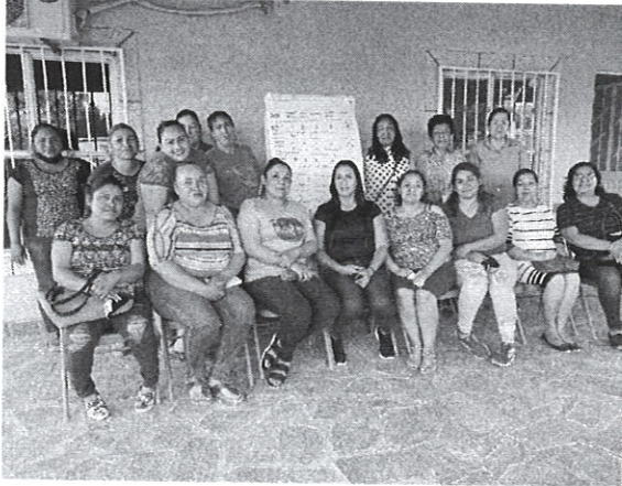
EJIDO ALFREDO V. BONFIL